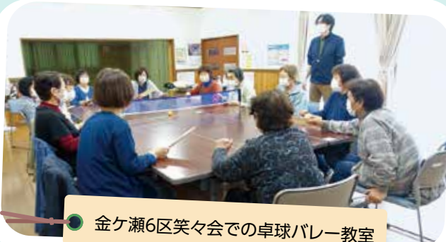
金ヶ瀬6区笑々会での卓球バレー教室