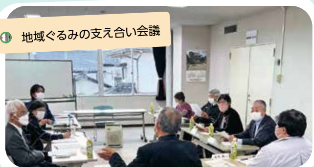
地域ぐるみの支え合い会議