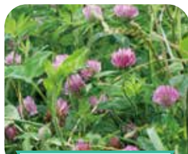
ムラサキツメクサ