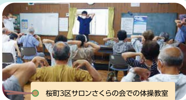
桜町3区サロンさくらの会での体操教室