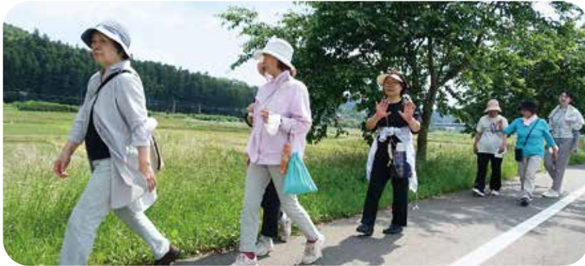
たくさんの野花や生き物を観察しながら歩けます。

最高気温30度になる日でしたが、土手の上は常に涼しい風が吹いており、葉桜になった桜の木が日陰を作ってくれるので、気持ちよく歩けました。