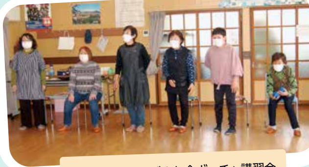
中町サロンなごやか会ポッチャ講習会