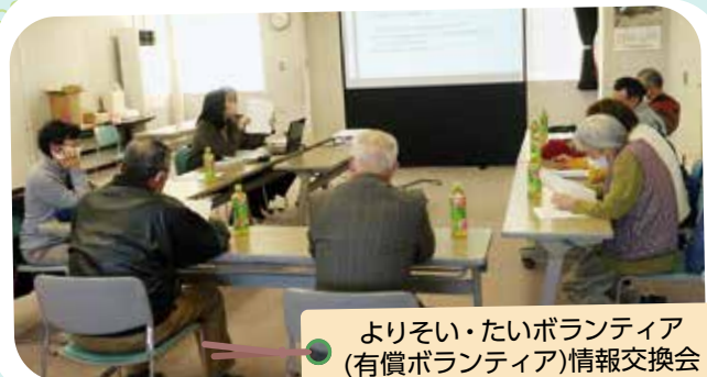
よりそい・たいボランティア(有償ボランティア)情報交換会