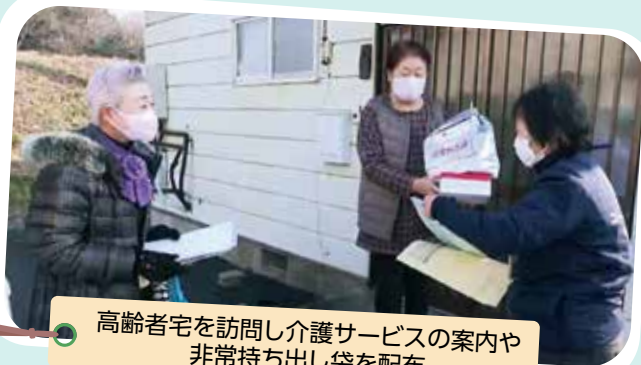
高齢者宅を訪問し介護サービスの案内や非常持ち出し袋を配布