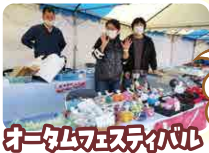
オータムフェスティバル

10月22日(日)オータムフェスティバルに出店させていただきました。さくらブランドは大好評により完売しました!!