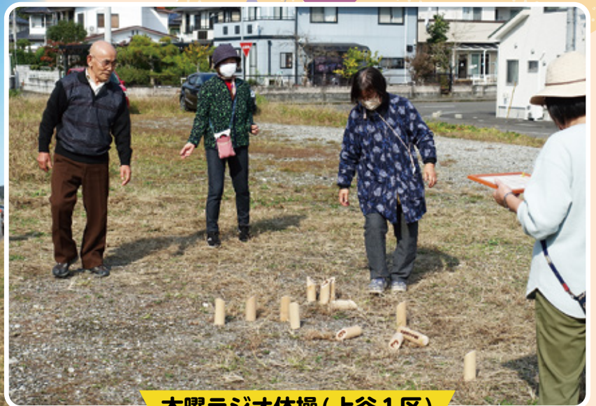
木曜ラジオ体操(上谷1区)