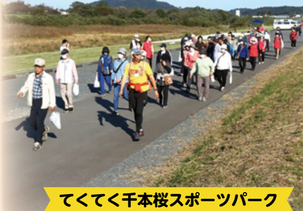
てくてく千本桜スポーツパーク