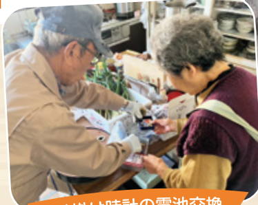
壁掛け時計の電池交換

ふだんの生活でのちょっとした困りごとを町内に住むボランティアの方がお手伝いしています。