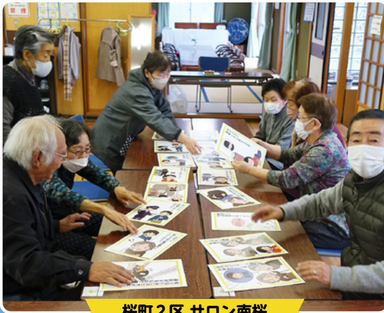
桜町2区 サロン南桜