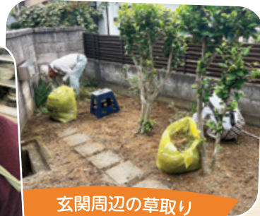
玄関周辺の草取り