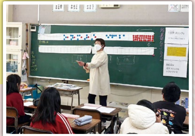
点訳グループ「てんとうむし」による点字体験

大河原町社会福祉協議会では、体験や当事者との交流を通じて、多様な人々を知り理解し、地域の中で子ども、高齢者、障がい者などすべての人々が共に支え合い暮らしていくことを考えるきっかけとすることを目的に小学校等での福祉体験学習を推進しています。