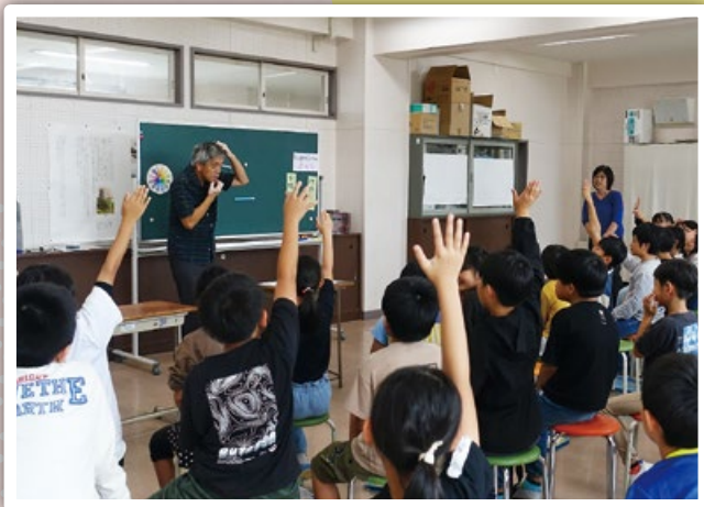
手話サークル「さくら」による手話体験