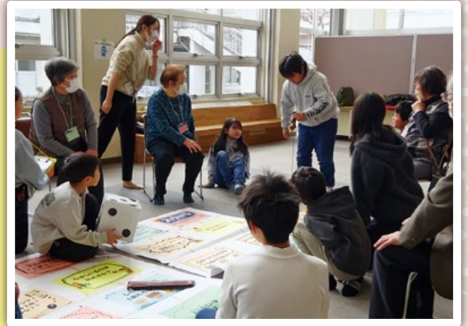
上谷一区レインボー会のみなさんとすごろくで交流