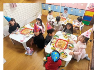
託児所ベビールームボエム クリスマス会への助成